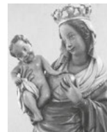
Mutter Gottes in Kapelle