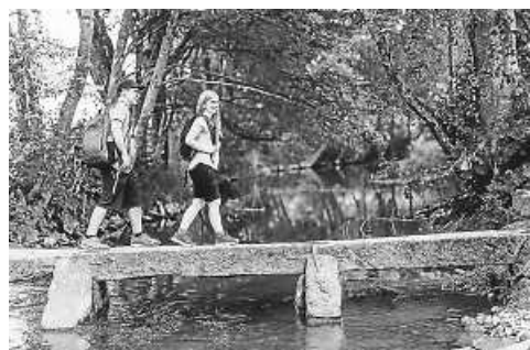
Entdecke deine Heimat neu

Der Heimat entdecken Newsletter präsentiert dir einmal in der Woche die schönsten Seiten von Baden-Württemberg. Werde selbst aktiv zum Heimatentdecker, lese die neuesten Artikel auf LOKALMATADOR.DE , tauche ein in die Nussbaum Erlebniswelt und lerne das Land von ganz neuen Seiten kennen. Als Nussbaum Club-Mitglied sparst du dabei sogar. Jetzt kostenlos anmelden unter https://www.lokalmatador.de/newsletter .