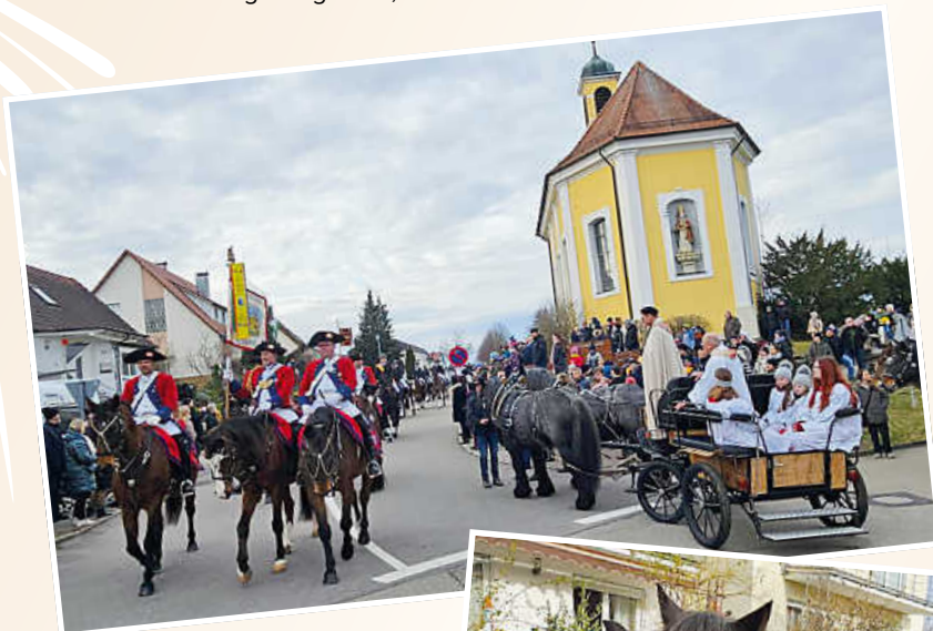
Unzählige Menschen nehmen an dem Ritt teil.