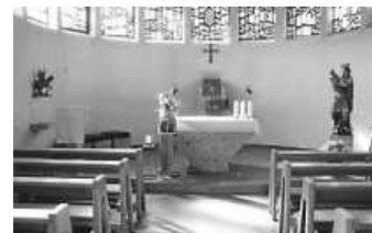
Kapelle St. Martin