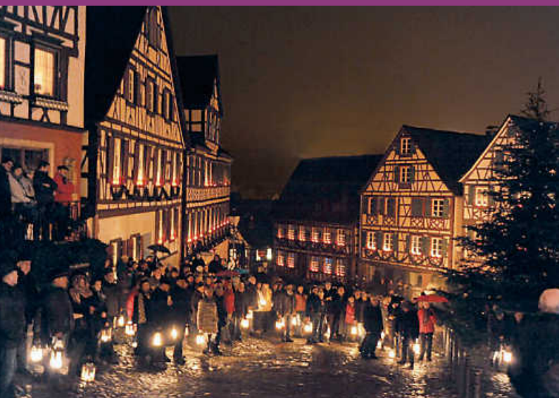
Mittelalterliches Flair: Laternen sorgen in der Stadt Schiltach für eine ganz besondere Atmosphäre.