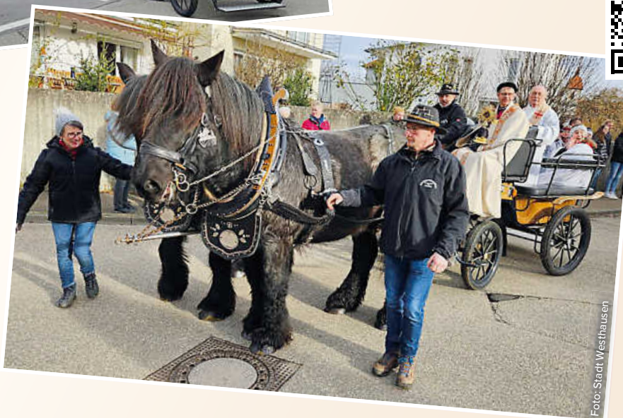
Der Silvesterritt führt hoch zur Wallfahrtskapelle.