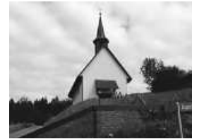
Kapelle St. Martin