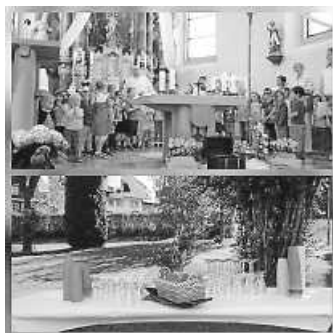
Die Kinder im Altarraum und der anschließende Umtrunk