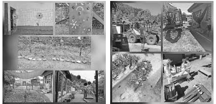
Impressionen aus dem Garten

Der Elternbeirat hat es sich mit einigen Eltern zur Aufgabe gemacht, den Außenspielbereich des Kindergartens St. Martin neu zu gestalten und zu verschönern. Ein neues Spielhaus wurde angeschafft und aufgebaut, das vorhandene Spielhaus neu gestrichen und eingerichtet, eine Kiesgrube zum Spielen und Baggern wurde errichtet, Rasen gesät, Blumen gepflanzt, ein Sichtschutz am Zaun gestaltet und angebracht, neues Sandspielzeug angeschafft, geputzt und gefegt und vieles, vieles mehr, brachte den Garten wieder zum Glänzen und animiert die Kinder zum neuen Spielen. Das Ergebnis wäre wunderschön. Wir möchten uns nicht nur bei unserem Elternbeirat und den Eltern bedanken, sondern auch bei den Firmen, die uns tatkräftig unterstützen und durch ihre Spenden einen großen Teil zum Gelingen beigetragen haben: Baggerbetrieb Lupfer (Bagger), Gärtnerei Gutmann Elzach (Blumenspende), Landschaftsbau Gerber Freiamt (Blumenspende), Malerbetrieb Limberger (Farbe für das Spielhaus). Ein ganz besonderes Dankeschön auch an unsere „Kindergartenpapas“, die mit viel Engagement und dem nötigen Fachwissen (Gartenhaus bauen, Bagger organisieren und bedienen, Kies beschaffen ...) uns auf unterschiedliche Weise unterstützt haben.