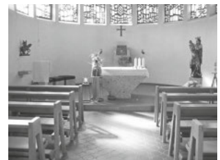
Herzlich willkommen

Zwischen Christi Himmelfahrt und Pfingsten steht die Einladung zum gemeinsamen Gebet der Pfingstnovene.