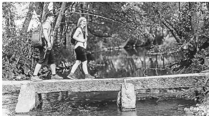
Entdecke deine Heimat neu

Der Heimat entdecken Newsletter präsentiert dir einmal in der Woche die schönsten Seiten von Baden-Württemberg. Werde selbst aktiv zum Heimatentdecker, lese die neuesten Artikel auf LOKALMATADOR.DE , tauche ein in die Nussbaum Erlebniswelt und lerne das Land von ganz neuen Seiten kennen. Als Nussbaum Club-Mitglied sparst du dabei sogar. Jetzt kostenlos anmelden unter https://www.lokalmatador.de/newsletter .