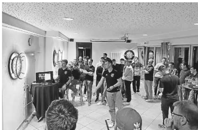
Einiges Los im Vereinshaus