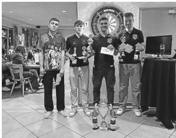
Die Sieger des diesjährigen Dartsturniers