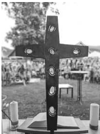
Tauffest an der Elz