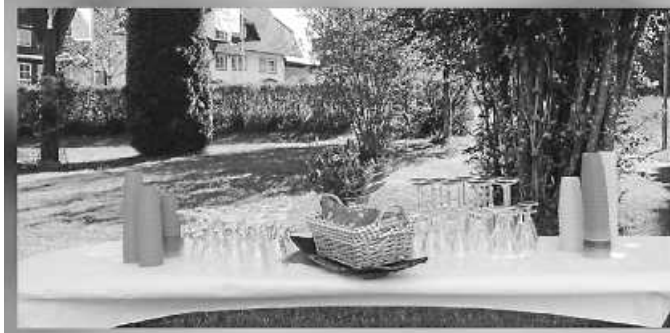
Die Kinder sammelten sich beim Gottesdienst im Altarbereich. Zum Abschluss gab es draußen einen kleinen Umtrunk