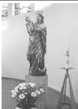
Mutter Gottes Maria

Vorschau Mittwoch, 01. April 2026, 18:30 Uhr - Gottesdienst