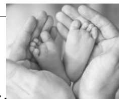
Überreichung der Geburtsbäume