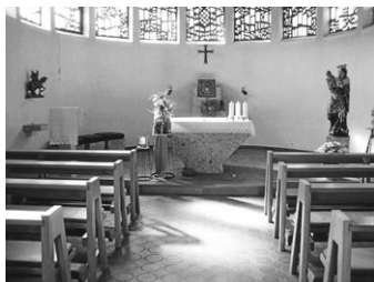
St. Martin, Gottesdienstraum