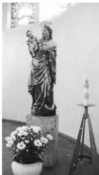
Mutter Gottes, Rosenkranzkönigin