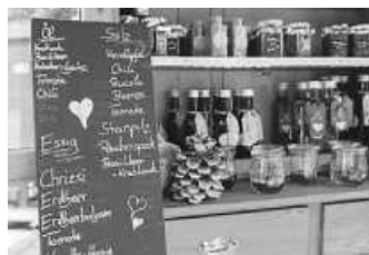
Leckereien, Selbstgemachtes und mehr lassen sich bei den Naturpark-Märkten entdecken

Mehr als einfach nur einkaufen kann man bei den Naturpark-Märkten, die in diesem Jahr wieder ab Mai in vollem Umfang stattfinden. Die Märkte sind mit ihrem reichhaltigen Programm rund um regionale Produkte, kulinarische Genüsse und Handwerk weit vielfältiger als ein gewöhnlicher Bauernmarkt. Im Mittelpunkt steht das umfassende Angebot an Erzeugnissen aus der Region: