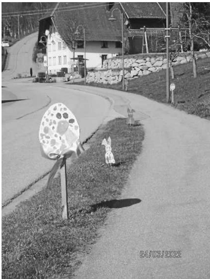
Frühlingsboten in Biederbach

Seit ein paar Tagen schmücken einige selbsthergestellte Frühlingsboten unsere Gemeinde. Das Projekt ist eine Gemeinschaftsaktion von Grundschule, Zwergenhaus, Bauernhofkindergarten (Grashüpfer) und dem Kindergarten St. Martin. Hintergrund war die Idee, den Ort zur Frühlingszeit, gemeinsam mit den Kindern, bunt und fröhlich zu gestalten. Vielen Dank an die Gemeinde und sämtlichen Helfern für die tatkräftige Unterstützung.