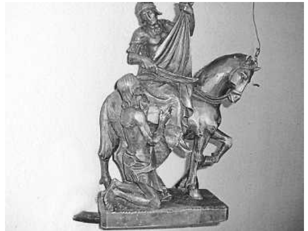
St. Martin - Patron der Kapelle