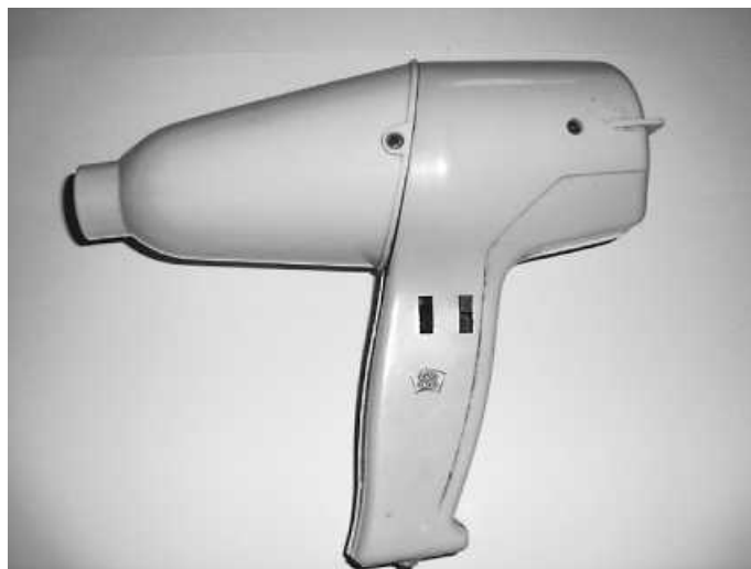
Haarfön von 1966 - Noch fast täglich im Dienst

Herzlichen Dank für die Mitarbeit. Wir in Biederbach.