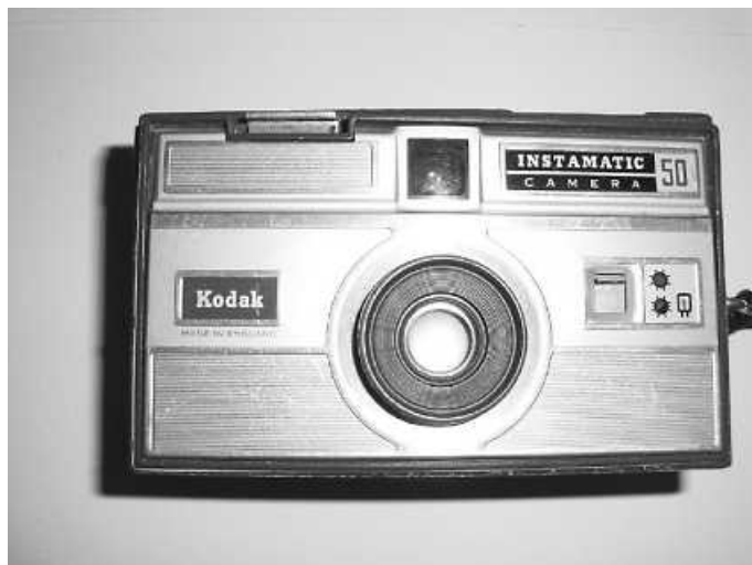
1967 Fotoapparat eines Berichterstatters der Badischen Zeitung