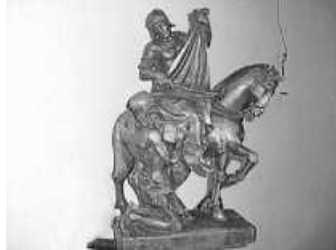
Statuette „St. Martin“

Mittwoch, 08. November 2023, 19:00 Uhr Mittwoch, 15. November 2023, 19:00 Uhr Herzliche Einladung!