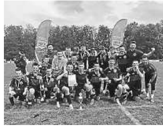
Bezirkspokalsieger der C-Junioren 2023