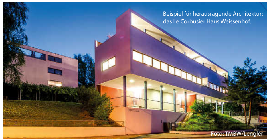
Beispiel für herausragende Architektur: das Le Corbusier Haus Weissenhof.

Und in der Stuttgarter Weissenhofsiedlung ist der Eintritt zum Museum nicht nur den ganzen Tag frei, auch die architektonischen Highlights von Le Corbusier können dort in Sonderführungen erkundet werden. (jr)