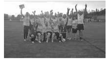
Bezirkspokalsiegerinnen der B-Juniorinnen 2023