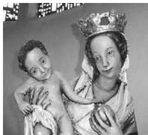
Einladung zum Rosenkranzgebet

In der Kapelle „St. Martin“ in Biederbach-Dorf ist wieder wöchentlich am Mittwochabend um 19:00 Uhr das Rosenkranzgebet.