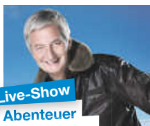
Live-Show Abenteuer Weltumrundung