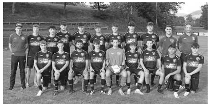
Foto: Trainer A-Junioren

Damit die Runde eine erfolgreiche Runde wird, ist entscheidend, wie das Team nach der Winterpause in die Rückrunde startet.