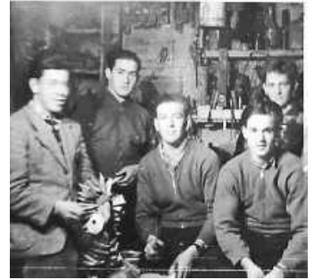
Scheibenherstellung vor dem Scheibenschlagen