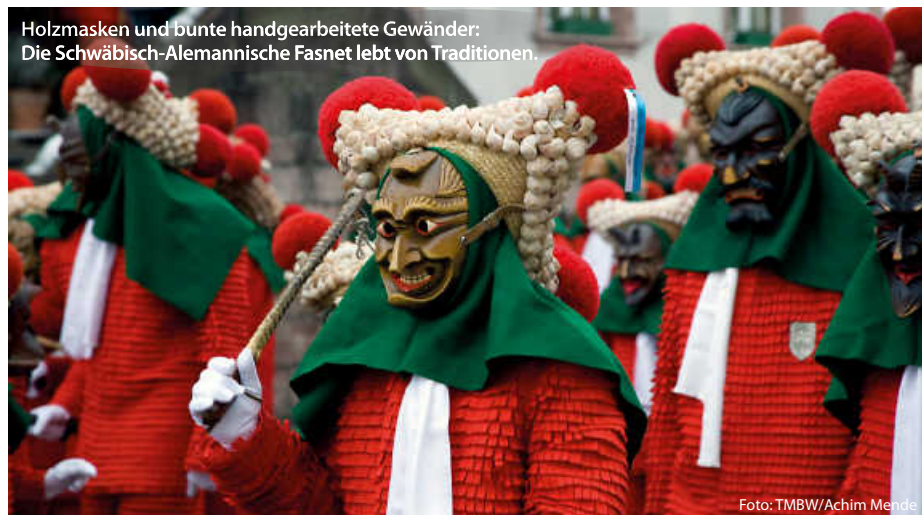
Holzmasken und bunte handgearbeitete Gewänder: Die Schwäbisch-Alemannische Fasnet lebt von Traditionen.

Am Aschermittwoch ist dann alles vorbei – fast, denn jetzt heißt es Bilanz ziehen und Geldbeutel waschen, die närrischen Tage, geprägt von Schlemmen, Trinken und Feiern, haben die Beutel geleert. Da bleibt nur noch die Rückgabe des Rathauschlüssels an den Amtsinhaber und Fasten – ganze 40 Tage lang bis Ostern. (pm/red/jr)